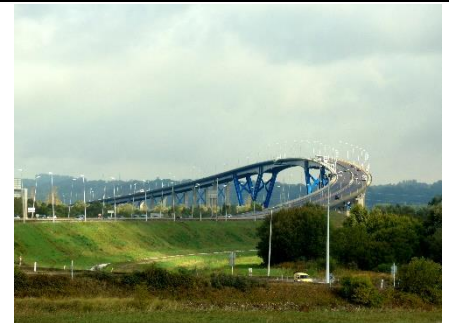
Viaduc du Havre

Ranger les ponts par ordre croissant de leur longueur en justifiant la réponse.