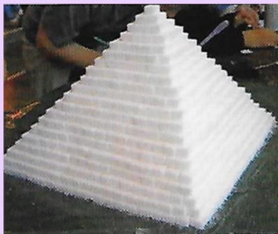
Pyramide en sucres